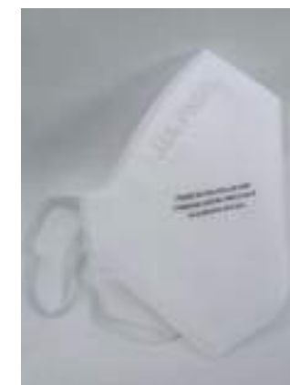
Tabla de precios