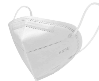
Tabla de precios