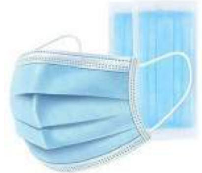
Tabla de precios